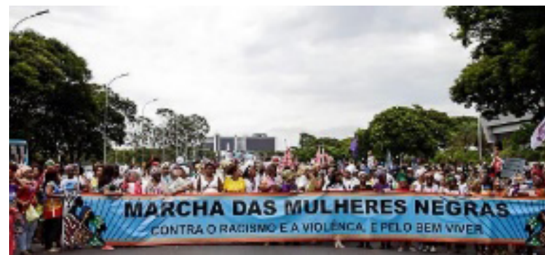
Figura 02 – A Marcha das Mulheres Negras 2015/Brasília