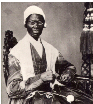
Figura 01 – Pioneiras do Feminismo Negro Norte-americano – Sojourner Truth